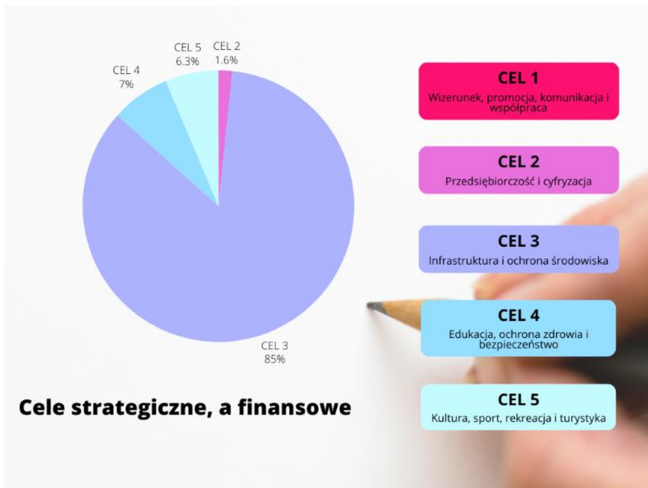
Rysunek 4. Procentowy rozkład środków na finansowanie celów Strategii.

Na uwagę zasługuje fakt, iż w roku 2023 na realizację Strategii zostało zaangażowanych o ponad 6.568.974,57 PLN więcej środków niż w roku 2022, a ten trend wzrostowy widoczny jest w każdym roku.