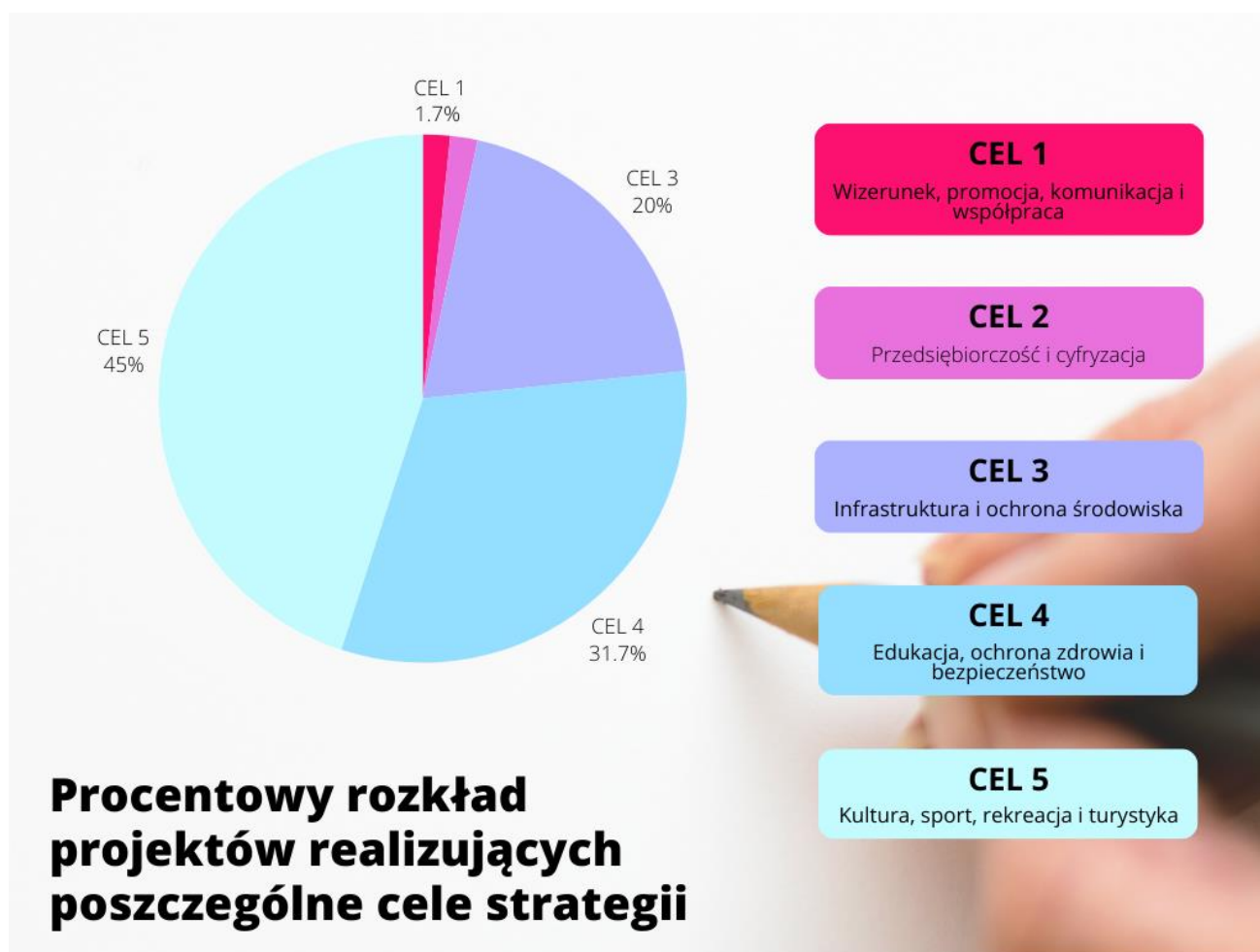
Rysunek 4. Procentowy rozkład projektów realizujących poszczególne cele Strategii

W dalszej kolejności zrealizowane projekty/działania/zadania wpisują się w cel strategiczny nr 1 i 2 (po 1 przedsięwzięciu), natomiast w cel nr 6 nie wpisało się bezpośrednio żadne z realizowanych przedsięwzięć.