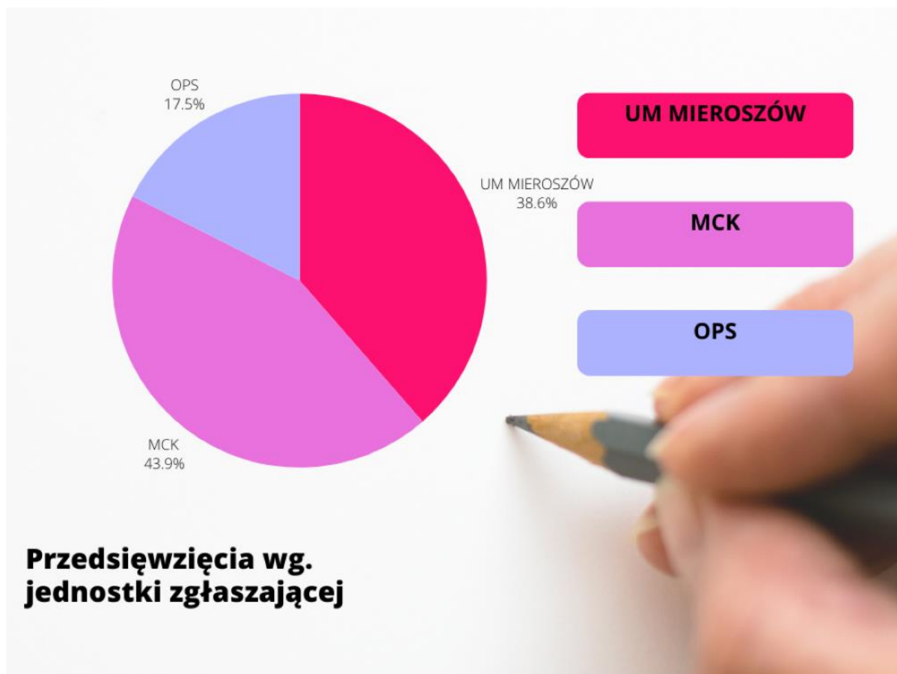
Rysunek 3. Przedsięwzięcia wg. jednostki zgłaszającej

Teren całej Gminy swoim zasięgiem objęło 46 (ponad 80%) przedsięwzięć zgłoszonych przede wszystkim przez Urząd Miejski w Mieroszowie, ale również przez Mieroszowskie Centrum Kultury i Ośrodek Pomocy Społecznej w Mieroszowie. Jedno przedsięwzięcie było realizowanych na terenie więcej niż jednej wsi czy miejscowości. Najwięcej, bo 8 projektów/działań/zadań zrealizowanych zostało w miejscowości Mieroszów (ponad 14%). W dalszej kolejności wśród projektów/działań/zadań, które swoim zasięgiem obejmowały obszar poszczególnych miejscowości na terenie Gminy, realizacje odbywały się w Sokołowsku (2), w Kowalowej (1), w Golińsku (1), w Rybnicy Leśnej (1) Na uwagę zasługuje fakt, iż