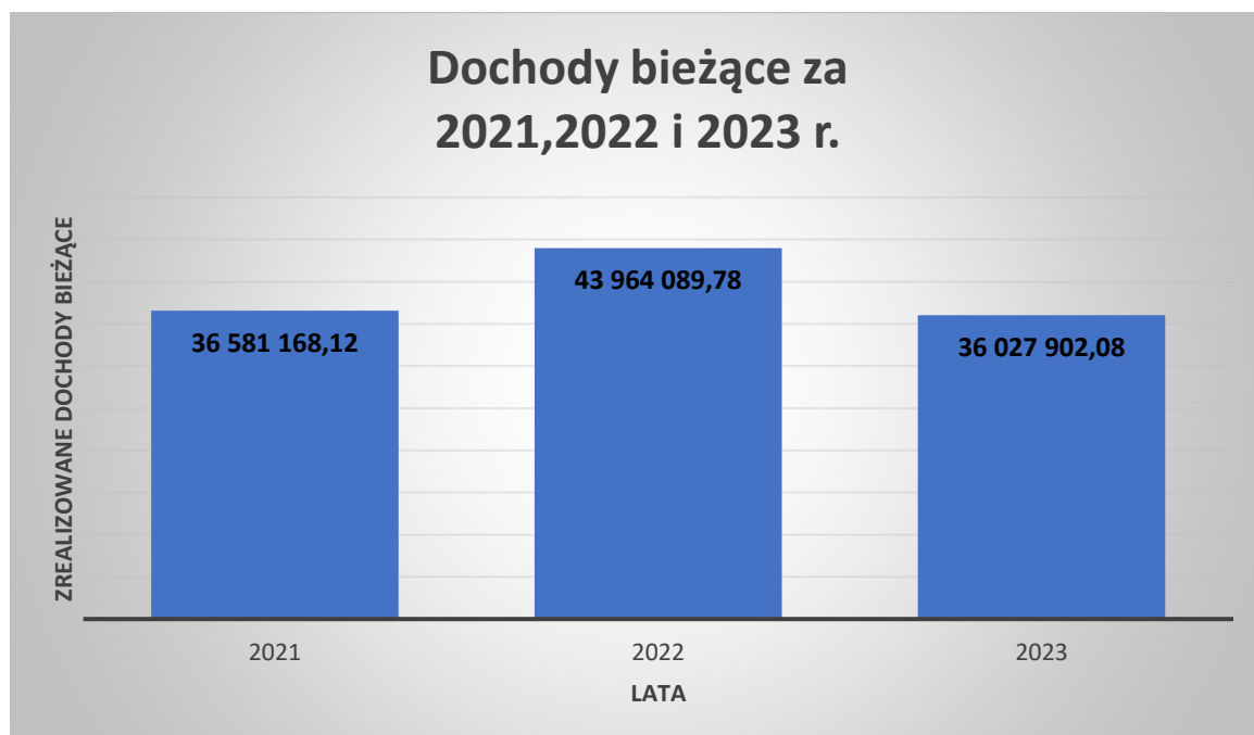
Wykres 1. Wykonanie dochodów Gminy Mioszów za : 2021, 2022 i 2023

Porównanie wykonania dochodów bieżących i majątkowych za lata 2021,2022 oraz 2023 rok przedstawiają poniższe wykresy.